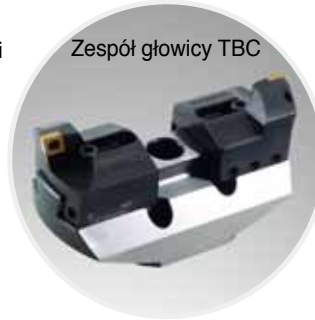
Zespół głowicy TBC